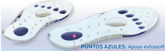
PUNTOS AZULES: Apoyo extrasoft