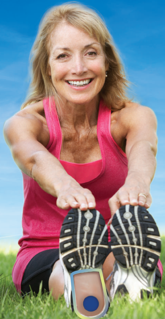
TALONERAS DE GEL