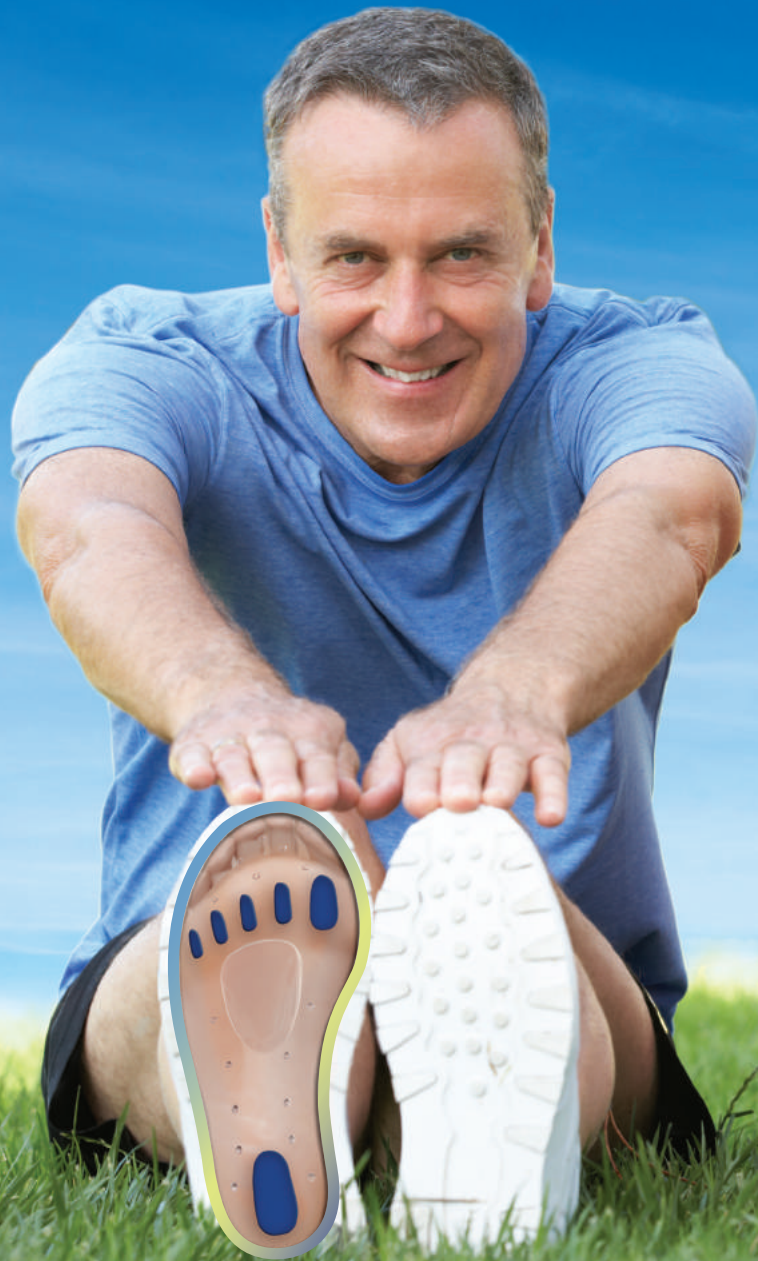
PLANTILLAS DE GEL